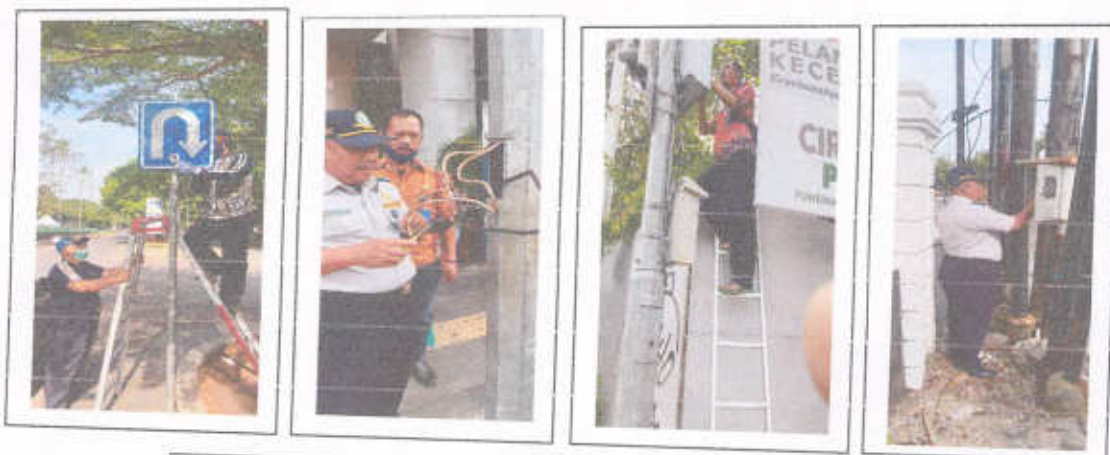
Gambar 3.5 Pemeliharaan Rambu dan Perbaikan Lampu APILL