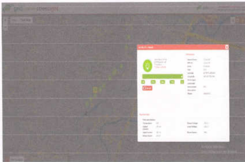
Gambar 1.2 Aplikasi Smart PJU