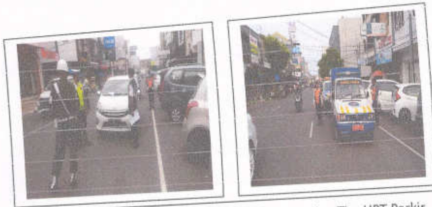
Gambar 3.1 Penertiban Parkir Oleh Tim Dalops dan Tim UPT Parkir