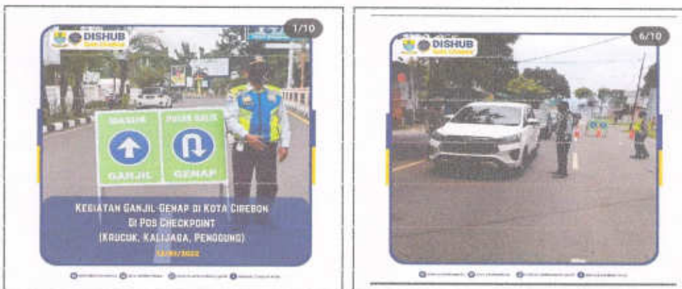
Gambar 3.10 Kegiatan Ganjil Genap