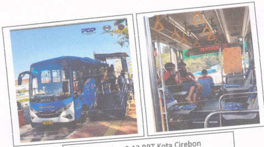
Gambar 3.13 BRT Kota Cirebon