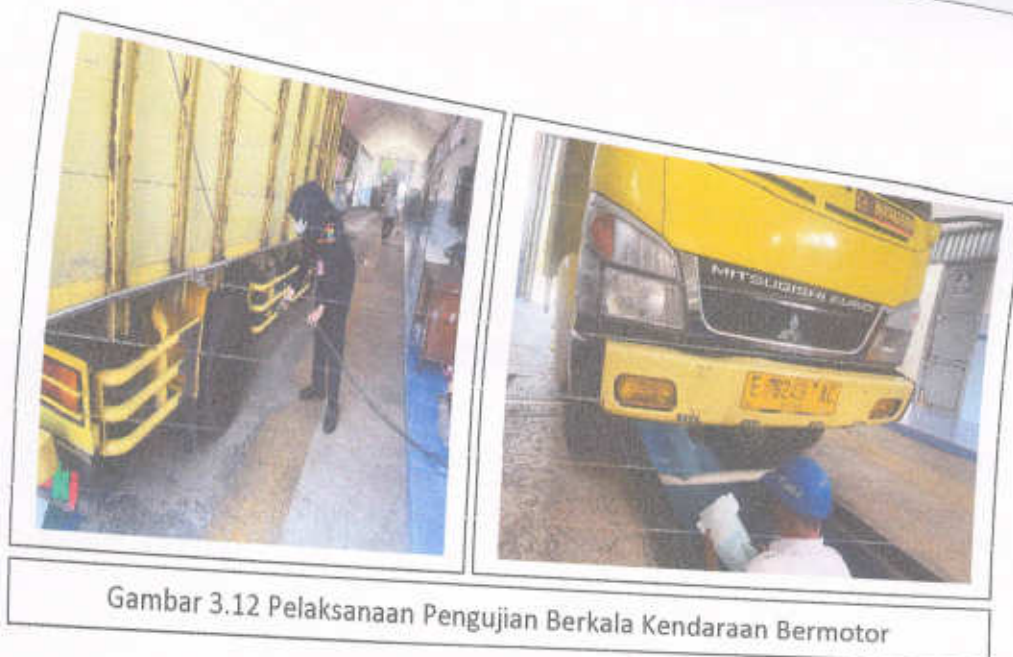
Gambar 3.12 Pelaksanaan Pengujian Berkala Kendaraan Bermotor