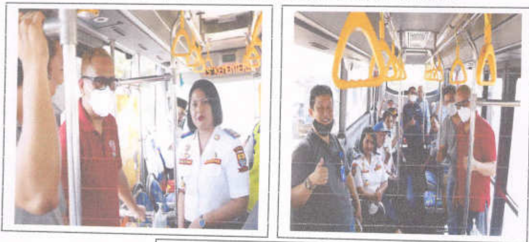
Gambar 3.11 Uji Coba BRT Kota Cirebon