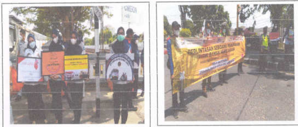
Gambar 3.7 Sosialisasi Keselamatan Pengguna Jalan