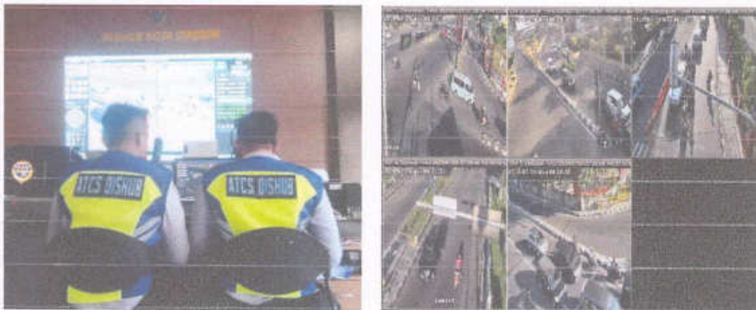
Gambar 1.5 Pantauan lalu lintas melalui ATCS

Pengendalian lalu lintas di persimpangan Kota Cirebon secara terpusat pada ruang kendali di Dinas Perhubungan Kota Cirebon melalui CCTV yang terpasang di beberapa persimpangan di Kota Cirebon.