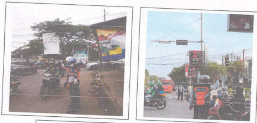
Gambar 3.3 Pelaksanaan Giat 68