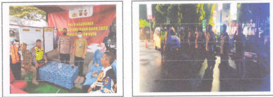
Gambar 3.6 Pelaksanaan Angkutan Lebaran dan NATARU