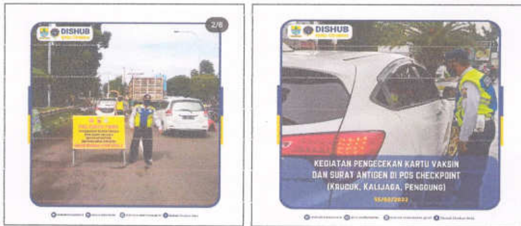
Gambar 3.9 Pengecekan Kartu Vaksin