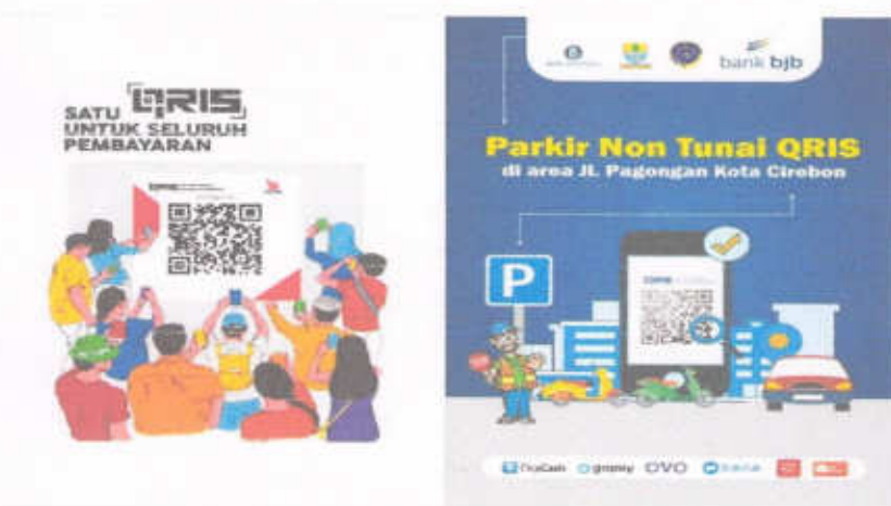
Gambar 1.3 Aplikasi QRIS

Adalah bentuk pembayaran parkir secara non tunai (gopay,ovo,shopeepay,dll) yang sudah diterapkan pada jalan pagongan, dan nanti kedepannya akan diterapkan di seluruh kantong parkir di Kota Cirebon.