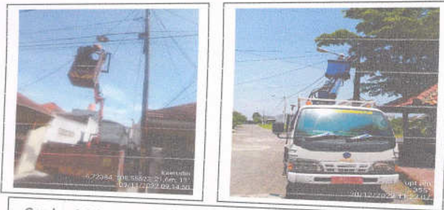
Gambar 3.2 Perbaikan Lampu Penerangan Jalan Umum oleh Tim PJU