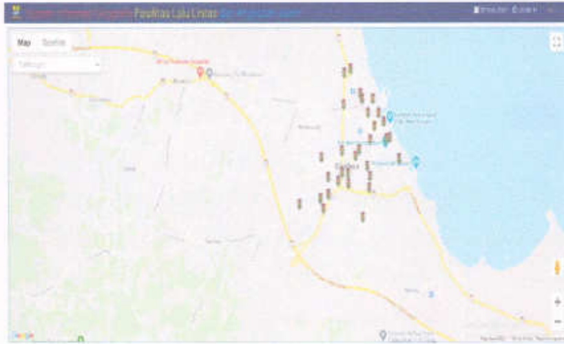
Gambar 1.4 Tampilan Website SIGFLLAJ