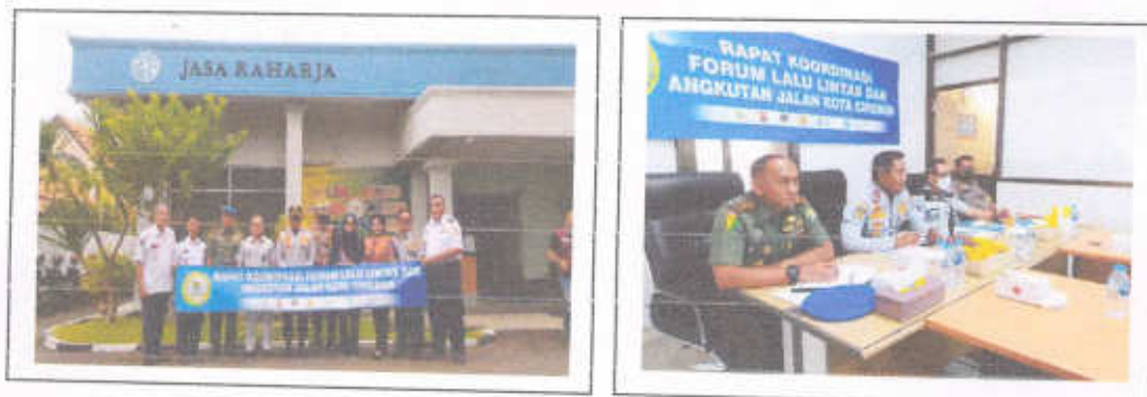
Gambar 3.8 Forum LLAJ